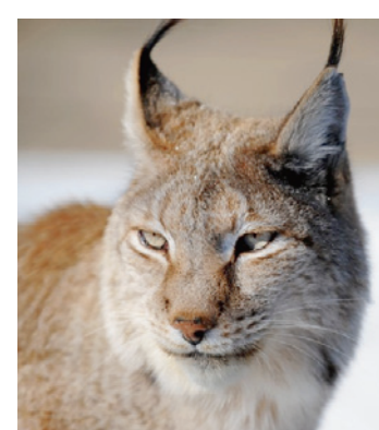
Le dernier lynx tué par un véhicule l'avait été en 2009 près de Valangin.