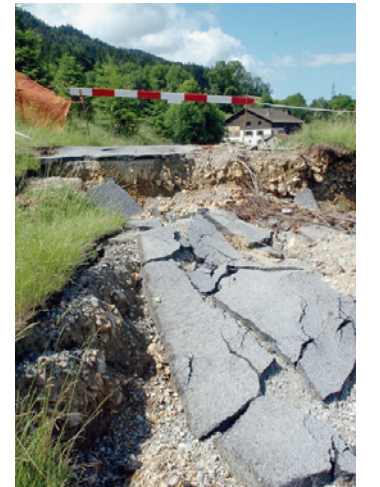
La route de la Banderette, emportée par un glissement de terrain en 2006, sera entièrement refaite.

HÔPITAUX Prise de position de l'exécutif de Val-de-Travers.